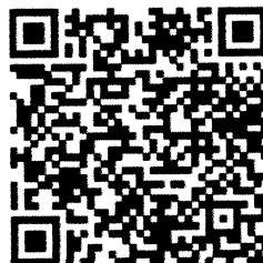
แบบกรอกข้อมูลผู้เข้าอบรม

๓. ตามข้อ ๒ ขอให้ผู้ประสงค์เข้ารับการอบรมกรณกรอกข้อมูลใน QR Code ด้านล่าง แจ้งให้ สบ.ทร.ทราบ อีกช่องทางหนึ่งด้วย