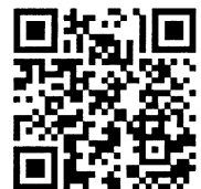
ประวัติการเดินทาง