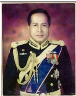
พล.ร.ต.เทียนชัย มังกร ๑ ต.ค.๔๓ - ๓๑ มี.ค.๕๖