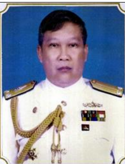
พล.ร.ต.กัมปนาท ภูเจริญยศ ๑ ต.ค.๕๙ - ๓๐ ก.ย.๕๐