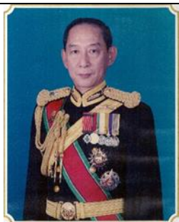
พล.ร.ต.กมล สุทธิสารสุนทร ๑ ต.ค.๕๗ - ๓๐ ก.ย.๕๘