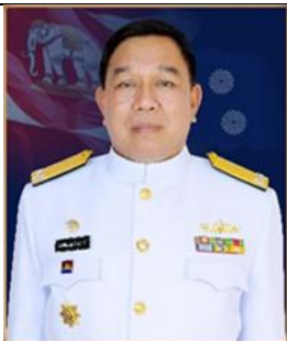
พล.ร.ต.กิตติโสภณ โตสมบัติ