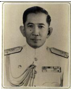
พล.ร.ต.ธวัชชัย ตรีเพ็ชร ๓๐ พ.ค.๒๑ - ๓๐ ก.ย.๒๒