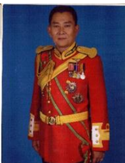
พล.ร.ต.สุรพงษ์ อัยसानนท์ ๑ ต.ค.๕๓ - ๓๐ ก.ย.๕๕