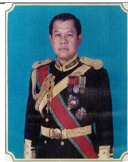
พล.ร.ต.ชูนนุม อางวงษ์ ๑ เม.ย.๕๖ - ๓๐ ก.ย.๕๗