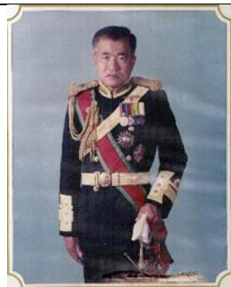
พล.ร.ต. ประสาท นนทลักษณ์ ๑ ต.ค.๓๘ - ๓๐ ก.ย.๔๐