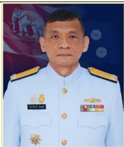
พล.ร.ต.ก้องเกียรติ สัจจวุฒิ