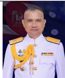
พล.ร.ต.บัญชา บัรรอด