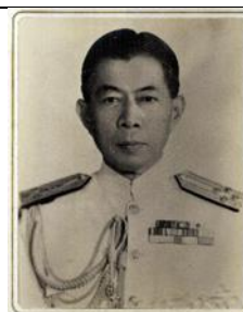
พล.ร.ต.ประเสริฐ ชุนงาม ๑ ต.ค.๑๒ - ๒๓ มิ.ย.๑๘