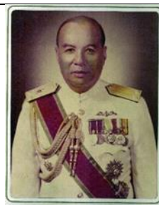
พล.ร.ต.อาคม ศรีคชา ๑ ต.ค.๒๖ - ๓๐ ก.ย.๒๙