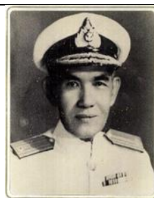
พล.ร.ต.หลวงสุทธิสารบรรจง ๑ ม.ค.๙๙ - ๓๑ ธ.ค.๐๑