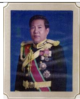
พล.ร.ต. ทวิช ปาลกะวงศ์ ณ อยุธยา ๑ ต.ค.๔๑ - ๓๐ ก.ย.๔๓