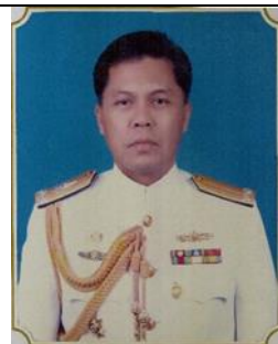
พล.ร.ต.ธนรัตน์ อุบล ๑ ต.ค.๕๘ - ๓๐ ก.ย.๕๙