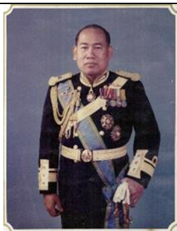
พล.ร.ต. จุลปรีชา วารุณประภา ๑ เม.ย.๓๔ - ๓๐ ก.ย.๓๔