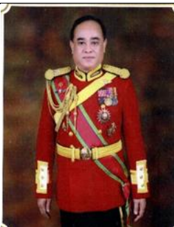
พล.ร.ต.เสมา สุวรรณโชติ ๑ ต.ค.๕๐ - ๓๐ ก.ย.๕๒