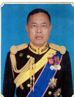
พล.ร.ต.มนตรีรักษ์ นิลกลัด ๑ ต.ค.๕๒ - ๓๐ ก.ย.๕๓