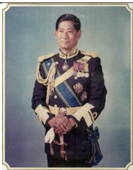
พล.ร.ต.ทวี มณีดิษฐ์ ๑ ต.ค.๓๒ - ๓๑ มี.ค.๓๓