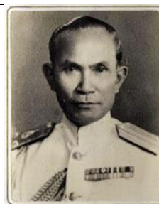
พล.ร.ต.พิณ พันธุ์ทวี ๑ ต.ค.๐๖ - ๓๐ ก.ย.๐๗