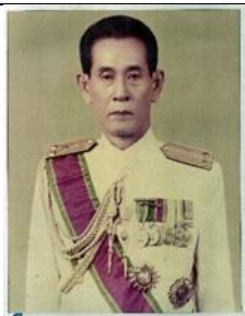
พล.ร.ต.ชัชวรินทร์ พุ่มอิมผล ๒๔ มี.ย.๑๘ - ๓๐ ก.ย.๒๐