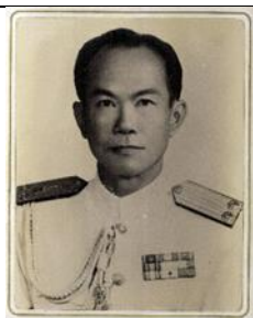
พล.ร.ต.ศิริ เสวตรักต ๑ ต.ค.๒๔ - ๓๐ ก.ย.๒๖