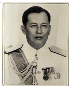
พล.ร.ต.สิทธิ์ สุรักขกะ ๑ ต.ค.๐๗ - ๓๐ ก.ย.๑๒