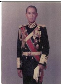
พล.ร.ต.ไพศาล บุญยศานติ ๑ ต.ค.๒๙ - ๓๐ ก.ย.๓๑