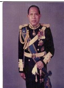
พล.ร.ต.ประดิษฐ์ เจริญมิตร ๑ ต.ค.๓๑ - ๓๐ ก.ย.๓๒