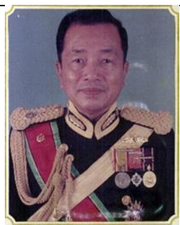
พล.ร.ต. ระวี เชาวนปรีชา ๑ ต.ค.๔๐ - ๓๐ ก.ย.๔๑