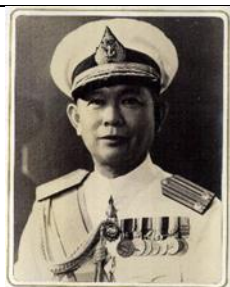
พล.ร.ต.อภัย สีดกะสิน ๑๔ พ.ค.๐๕ - ๓๐ ก.ย.๐๖