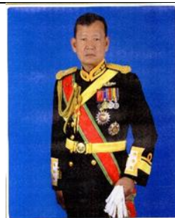
พล.ร.ต.ปัญญา เล็กบัว