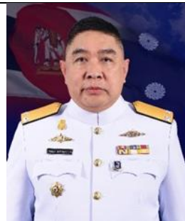
พล.ร.ต.เบญญา นาวานุเคราะห์